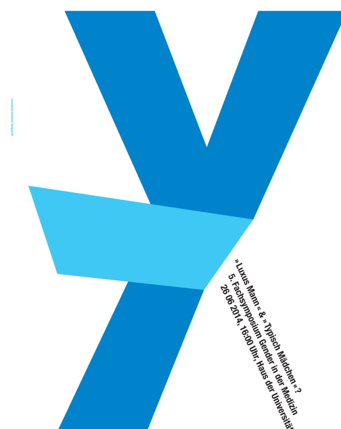
Abb. 3: Poster Fachsymposium Düsseldorf 2014

„Man kann gute Lehratmosphäre nicht erzwingen [...], man kann nur den Boden bereiten [...] und ich denke, das ist genau das was man hier anwenden sollte. Und das (Gender Lens) Tool halte ich für ein Gutes dafür.“ (m)